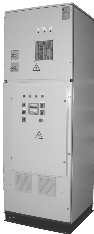
Рис. 3. ПАД-В-К-100-6к-1.

6. Плавный пуск группы высоковольтных асинхронных электроприводов центробежных механизмов / А.А. Ткачук, В.К. Кривовяз // Насосы&оборудование. 2009. № 2(55).